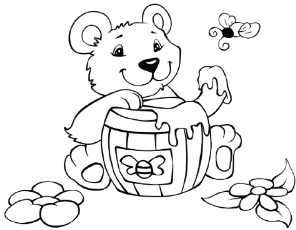
Immagine per il dettato "Alla ricerca di un po' di miele".